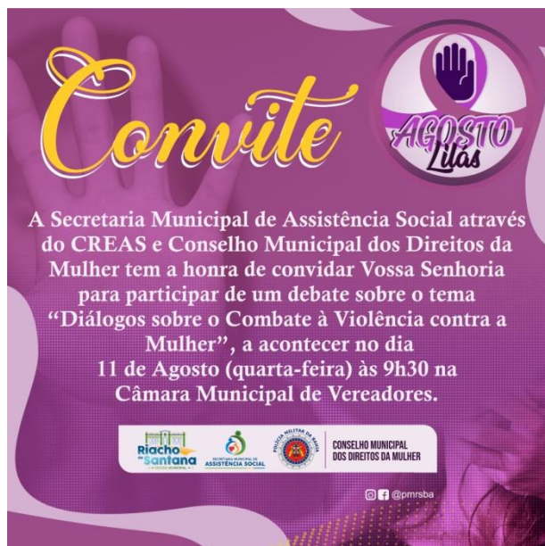
Campanha Agosto Lilás, combate à Violência contra a Mulher 1/08/2021