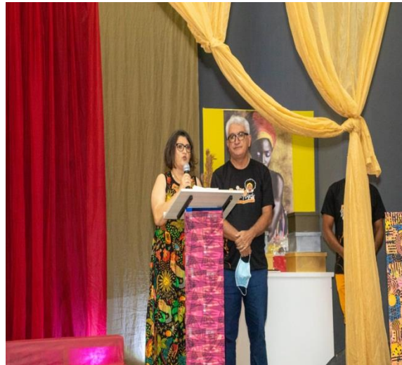
Abertura da Culminância do Projeto Riacho Novembro Negro 27/11/2021.