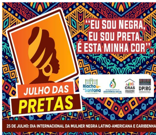
Campanha do Julho das Pretas 10/07/2021