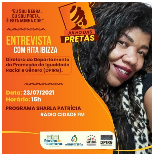
Entrevista na Rádio FM sobre Julho 23/07/2021 LGBTQIA+ Realizado pelo CREAS