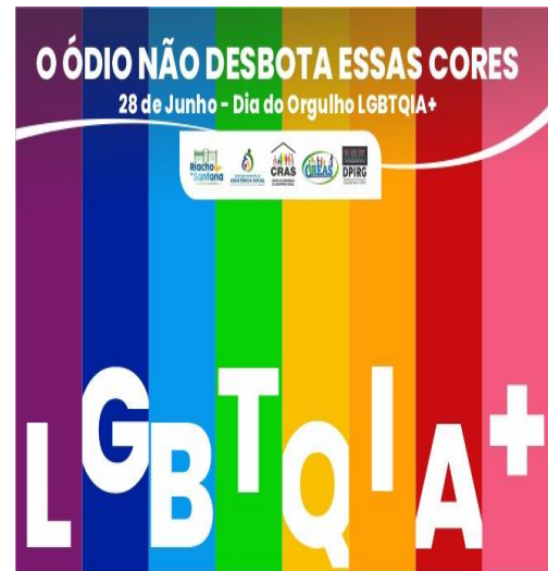
Projeto CRAS, CMDCA e DPIRG 28/07/2021.