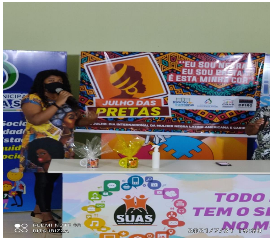
Finalização do projeto Julho das Pretas na LIVE projeto vidas realizado pelo CRAS I, no dia 31/07/2021.