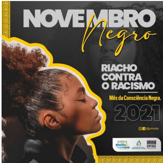
Projeto Novembro Negro Contra o Racismo 20/11/2021.