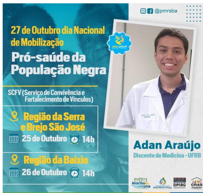
Palestra Pró-Saúde da População Negra, Convidado o Discente de Medicina –UFRB