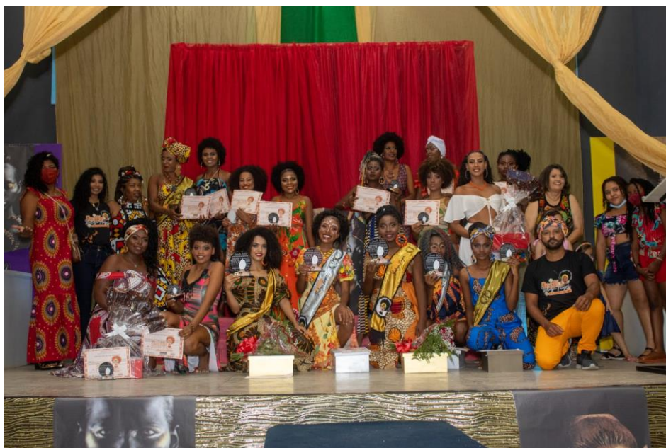
Finalizando o Projeto Desfile da Beleza Negra através de uma Live 27/11/2021.