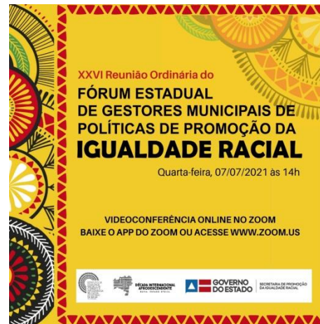
Participação do Fórum Estadual Gestores 07/07/2021.