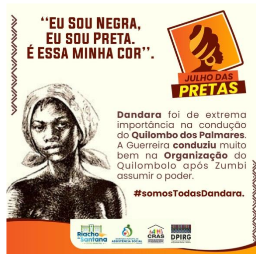
Projeto julho das Pretas: homenagem a Dandara esposa de zumbi dos Palmares #SomosTodasDandara 16/07/2021