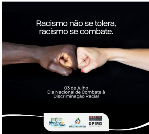
Campanha sobre o dia Internacional de combate a discriminação Racial 03/07/2021.