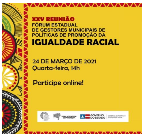
1º Reunião do Fórum de Gestores 24/04/2022